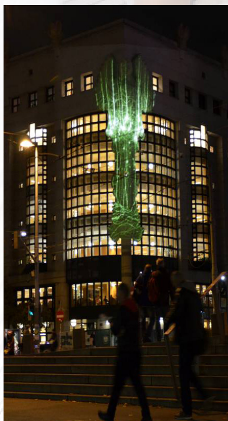
... und bei Nacht im Rahmen von „Search for Truth“

mithilfe von Teleskopen. Diese Darstellungen helfen uns, komplexe Phänomene sowie wissenschaftliche Erkenntnisse zu verbildlichen und zu verstehen, die Forschung voranzutreiben, Wissen zu schaffen und zu vermitteln und uns der Wahrheit in einer immerwährenden Suche anzunähern. In Zeiten von Unsicherheit ist die Bibliothek ein Ort für die Suche nach Wahrheit. Die Skulptur der Eule als Symbol für Weisheit und Gelehrsamkeit, mit ihrer durchaus eigentümlichen Ästhetik des phantastischen Realismus wurde zum Wahrzeichen der TU Wien und durch ihre Exponiertheit zum urbanen Orientierungspunkt.